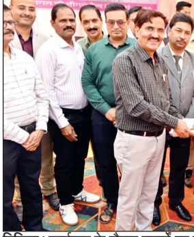
विदिशा। कार्यक्रम के दौरान बुजुर्गों का सम्मान करते हुए अतिथिगाण।