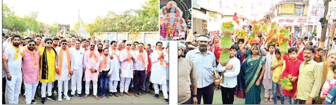
विदिशा। रघुवंशी समाज की शोभायात्रा में बड़ी संख्या में समाजजन शामिल हुए। वहीं नवमी पर ज्वारों का जुलूस निकाला गया। बेतवा तट पर पूजा अर्चना हुई।

रामनवमी पर रघुवंशी समाज द्वारा मर्यादा पुरुषोत्तम भगवान श्रीराम की भव्य और आकर्षक शोभायात्रा निकाली। करीब एक किमी लंबी इस शोभायात्रा को 2 किमी की दूर तय करने में 4 घंटे का समय लगा। गायक कलाकारों ने धार्मिक भजनों की प्रस्तुति दी। ढोल, बँड, डीजे, ढपलों की गूंज पूरे बाजार में सुनाई दे रही थी। शाम 6 बजे नीमताल से शुरू हुई शोभायात्रा को निकाला तक पहुंचने में ही ढाई घंटे का समय लगा। सुरक्षा के लिए पुलिस बल तैनात रहा।